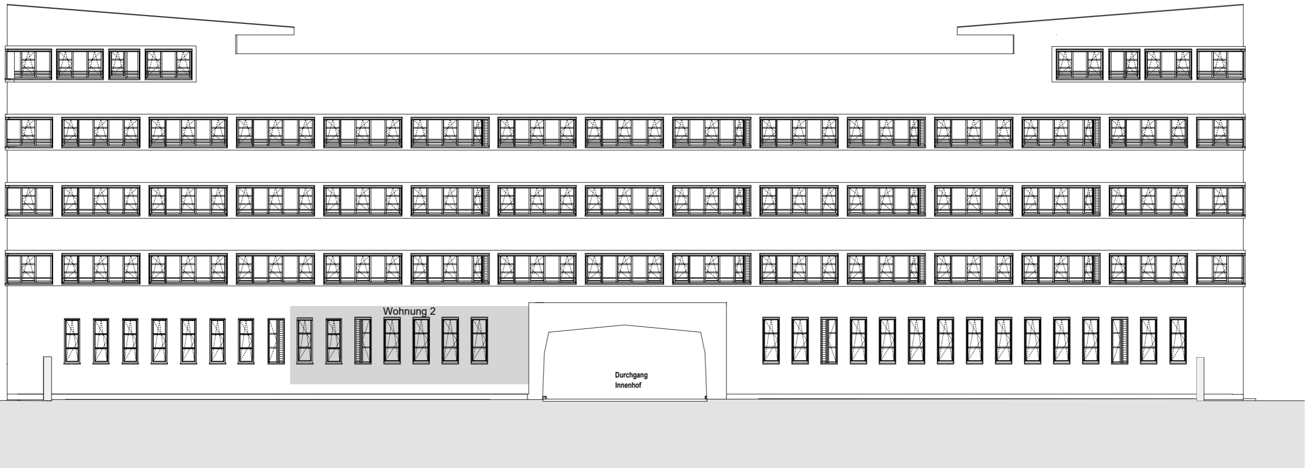
Ansicht Südost - BT6