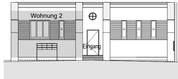
Ansicht Durchgang Nordost - BT6