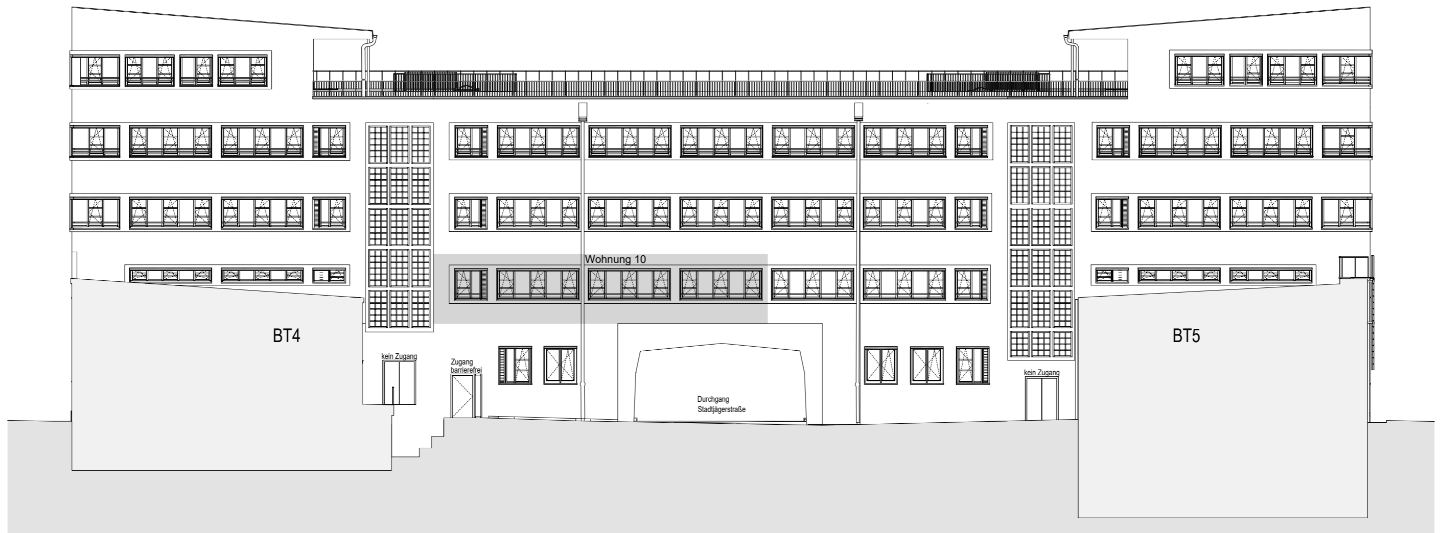
Ansicht Nordwest - BT6